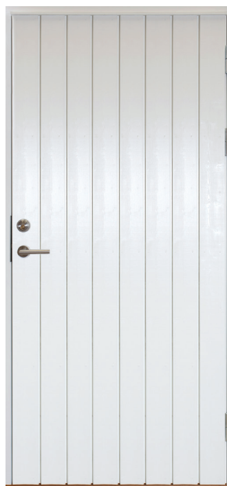
Fjällbacka är lagervara i storlek: 10x21