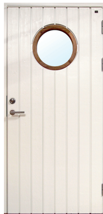
Fjällbacka kan göras med runt glas i lagerförd storlek. Glasring i FSC®-certifierad Furu som standard. Teak som tillval.