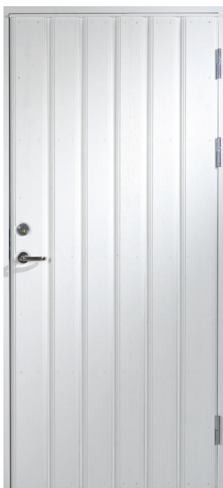
Ramsvik är lagervara i storlek: 9x20, 9x21 & 10x21