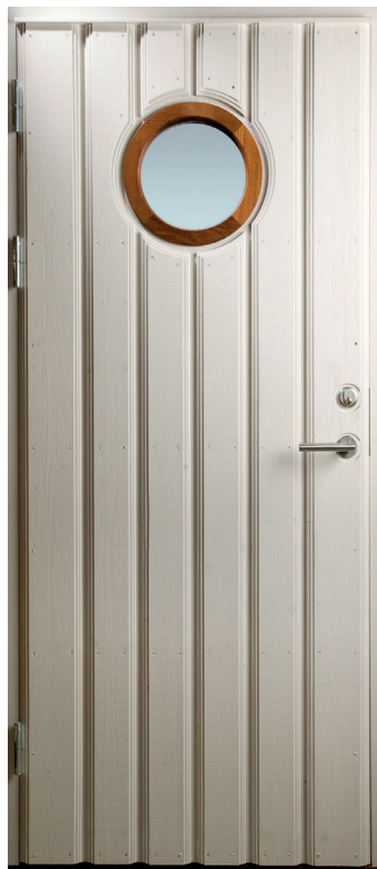
Ramsvik kan göras med runt glas i alla lagerförda storlekar. Glasing i FSC®-märkt Furu som standard